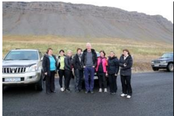
Heilbrigðisfólk tilbúið í slaginn