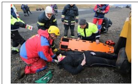
Samvinna við björgun