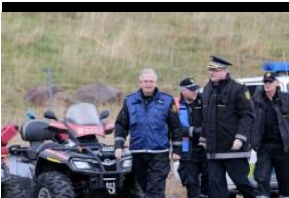
Lögreglustjóri, yfirlögregluþjónn, löggur