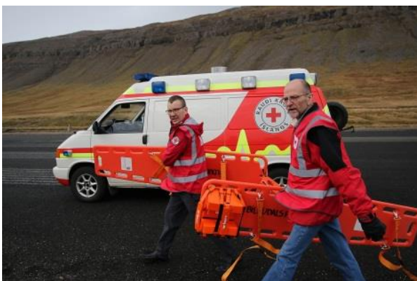
Rauða kross menn á hlaupum