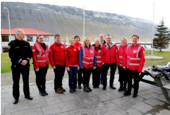
Rauða kross fólk

Aldrei bið eftir áverkamati hjá rauðum og gulum sjúklingum. Röðuðu grænum sjúklingum sem voru liggjandi á gula svæðið, skynsöm ákvörðun þar sem græna svæðið er líti og ekki pláss fyrir liggjandi þar.