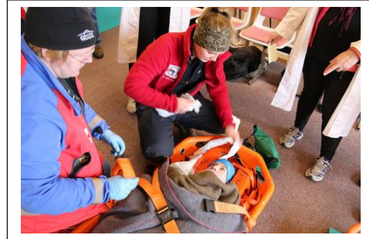
Frá söfnunarsvæði slasaðra