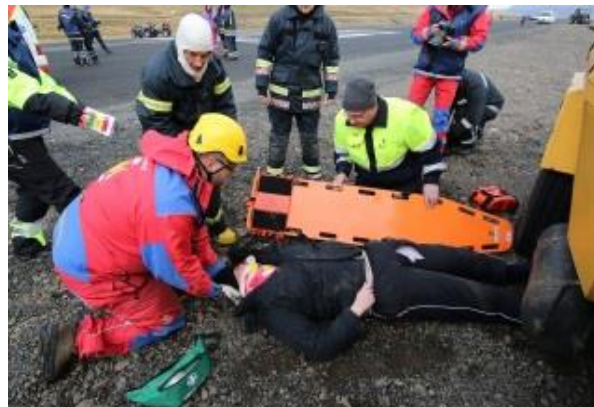
Samvinna á slystað