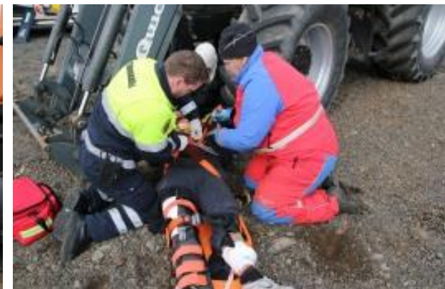
Unnið að björgun