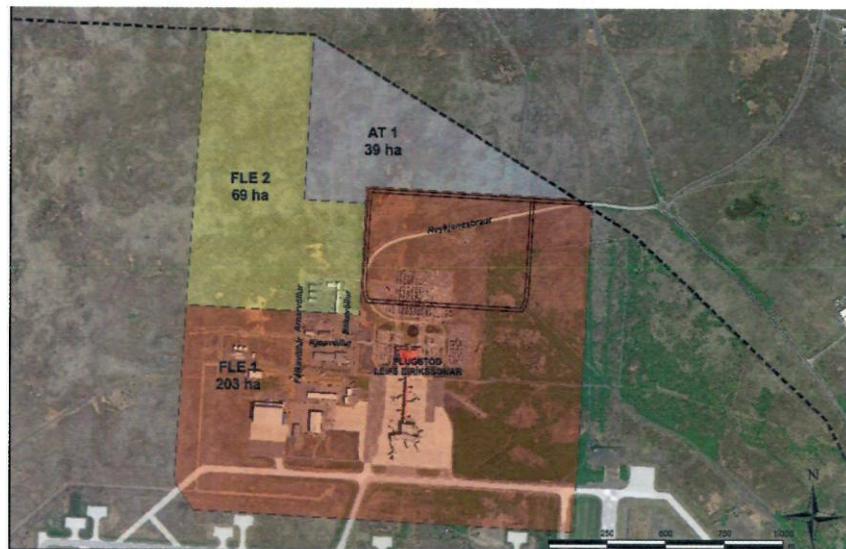
Mynd 1 Flugþjónustusvæði við flugstöð FLE 1 og FLE 2

Við mótun deiliskipulags fyrir flugþjónustusvæðin (FLE1, FLE2 og HLH) á Keflavíkurflugvelli hefur verið horft til þróunaráætlunar Keflavíkurflugvallar 2015-2040 og aðalskipulags Keflavíkurflugvallar. Við skipulag á svæði FLE2 hefur komið í ljós að verulega vantar upp á byggingarheimildir á svæðinu til að vera í samræmi við þá starfsemi sem er fyrirhuguð á svæðinu. Starfsemi er fyrst og fremst flugstarfsemi og flugtengd starfsemi, en henni getur fylgt mjög umfangsmiklar byggingar s.s. flugskýli, vörugeymslur og þjónusturými. Starfsemi getur hvergi annars staðar verið en innan flugvallarsvæðis.