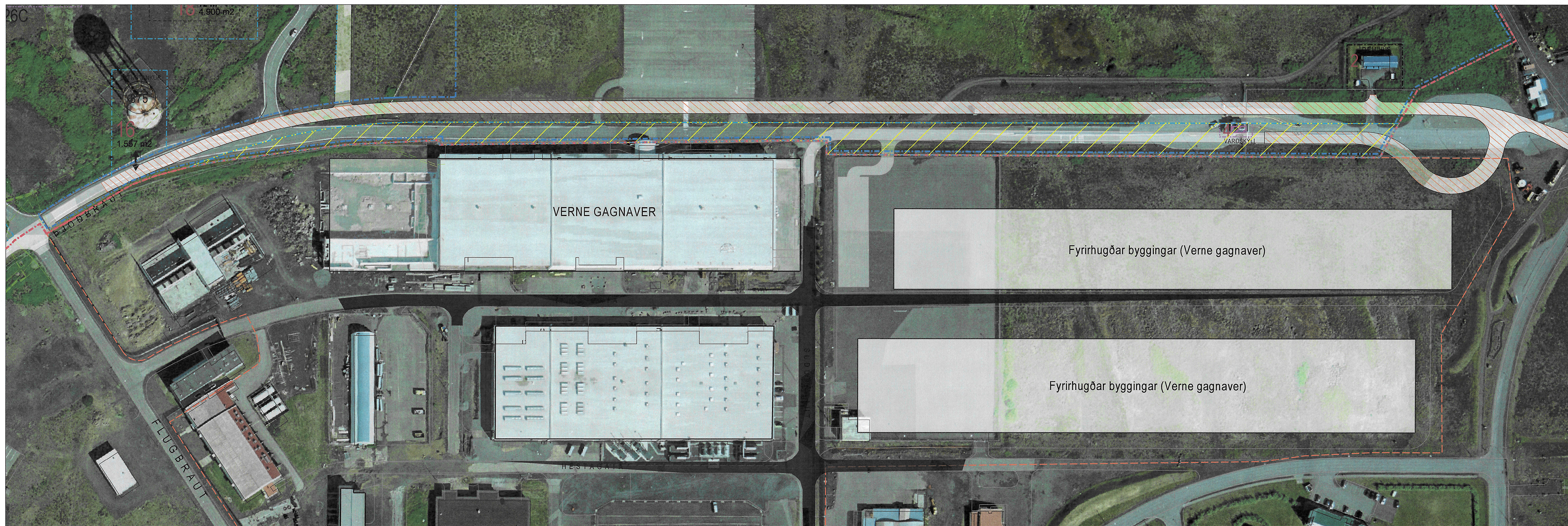
LÖÐ VERNE - SKÝRINGARMYND

Auglýsing um gildistöku breytingarinnar var birt í B-deild Stjórnartíðinda þann 20.11.2023